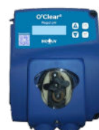
Régulateur pH (en option)