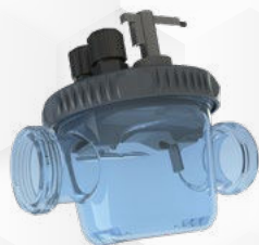
Chambre de mesure Uniquement Phileo POD VP

La pompe doseuse s'éclaire en fonction de la mesure et des alertes. En un coup d'oeil , vous avez une vision claire du pH de votre piscine ! Gain de temps et simplicité assuré durant la saison !