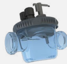
Chambre de mesure Uniquement Phileo POD VP